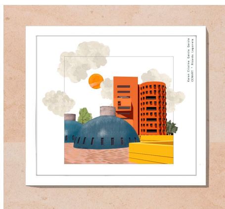
Resultados de alumnos, emisión Junio 2020-2021.