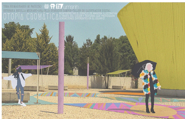
Resultados de alumnos, emisión Junio 2019.

Material didáctico elaborado por el docente.