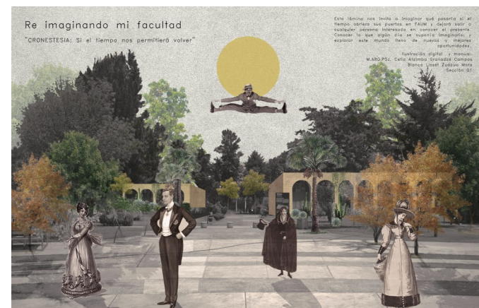
Resultados de alumnos, emisión Junio 2019.

Materia optativa Ciclo escolar : 2021-2021